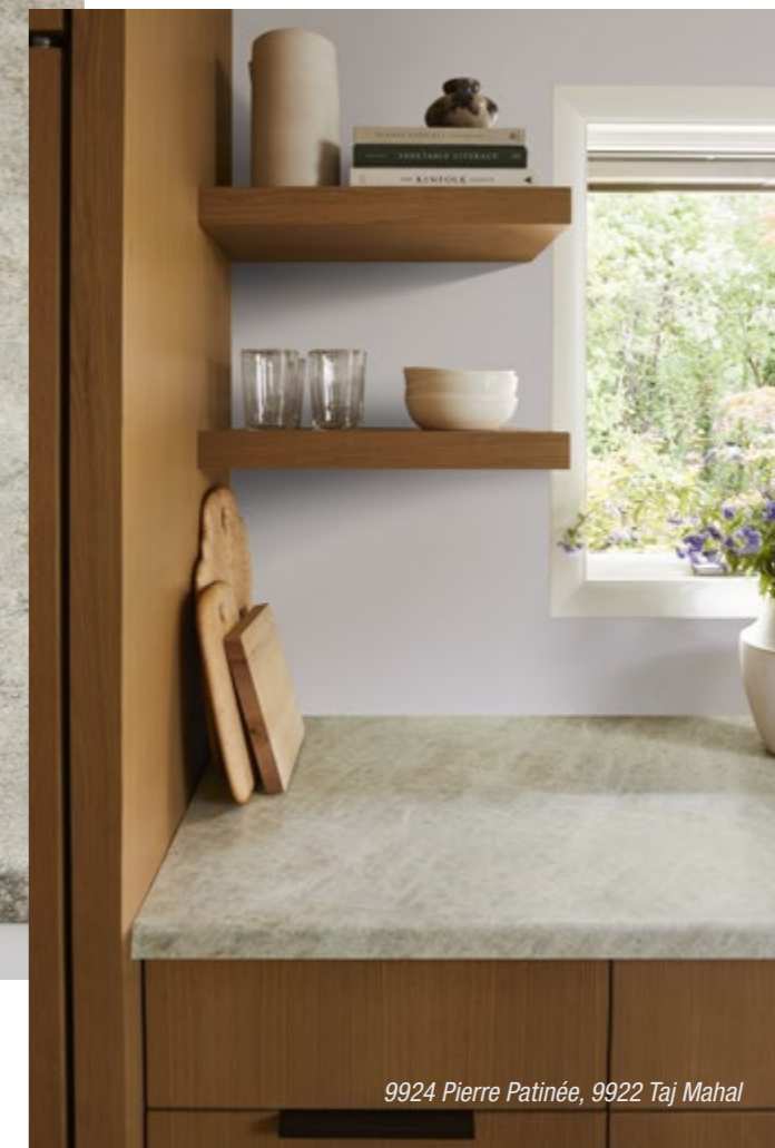
9924 Pierre Patinée, 9922 Taj Mahal