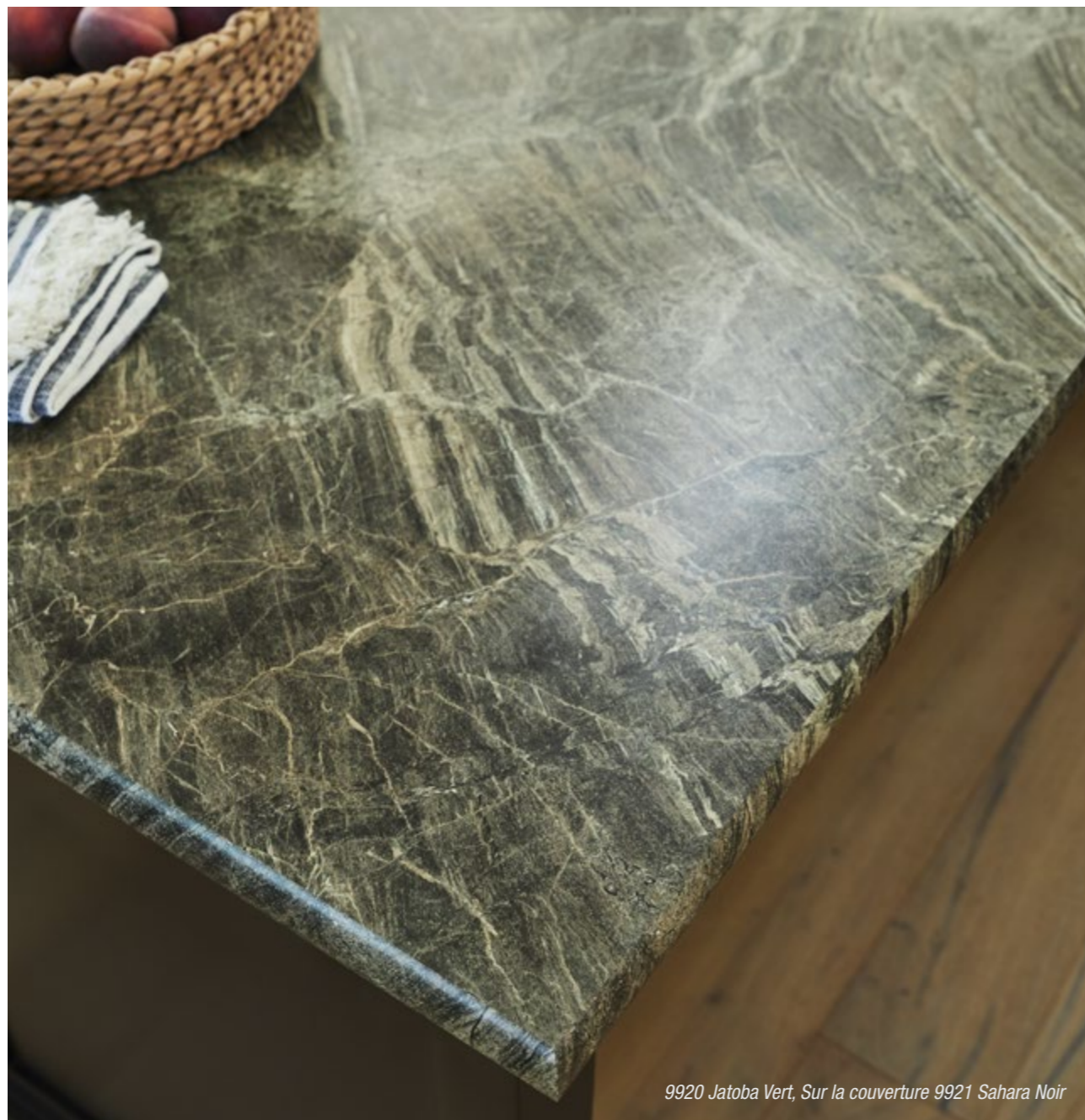
9920 Jatoba Vert, Sur la couverture 9921 Sahara Noir